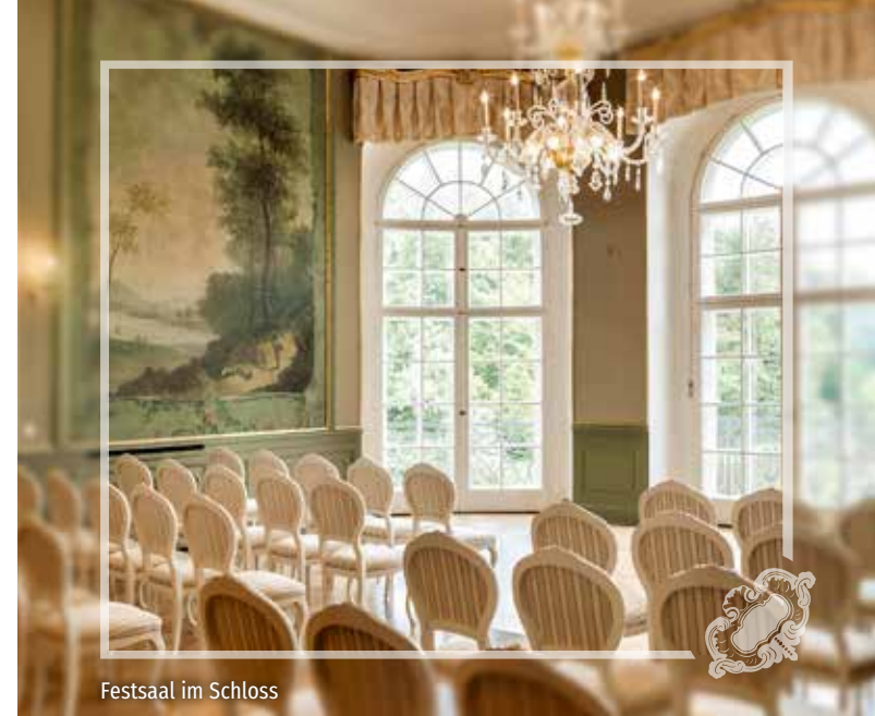
Festsaal im Schloss